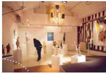
Modules au sol de 10 m 2 avec mise à disposition de 6 plots.