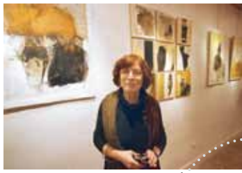
Modules muraux de 5 m. linéaires avec cimaises fournies